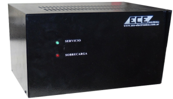
Imagen de carácter ilustrativo